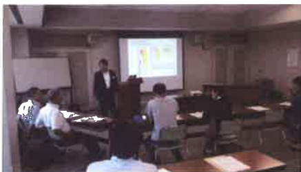
ワークショップ風景(イメージ)